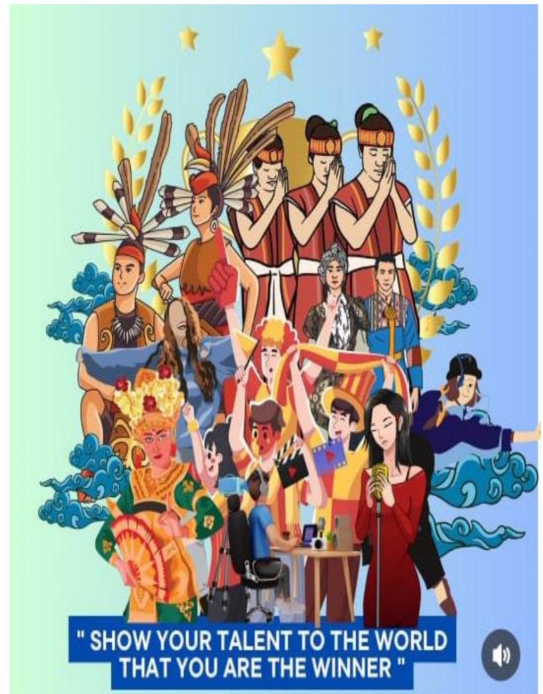
DOKUMENTASI LOGO PORSENI