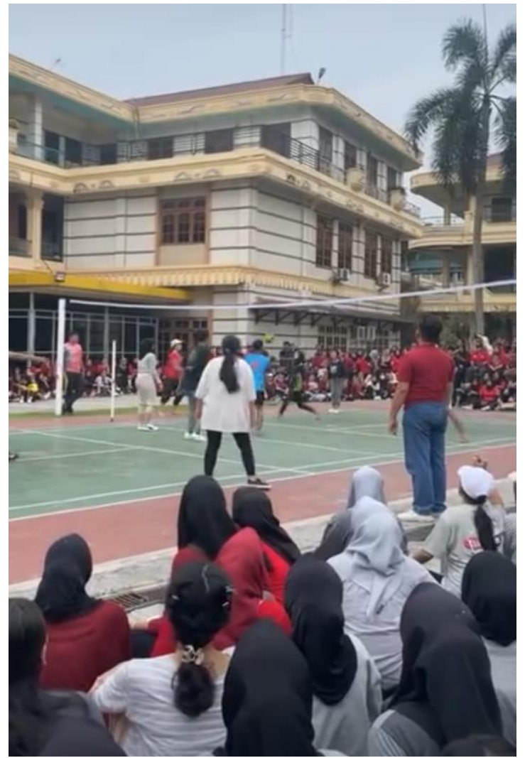
Dokumentasi dibidang Olah Raga Lomba Futsal, Lomba Bulu Tangkis, dan Bola Voley