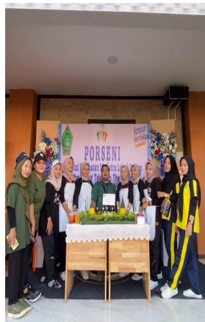
Dokumentasi Lomba Membuat Tumpeng Dan Dekorasi di setiap Fakultas