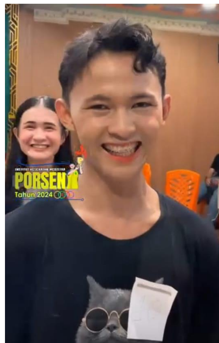
Dokumentasi Lomba Estafet Tepung, Lomba Make Up Challenge