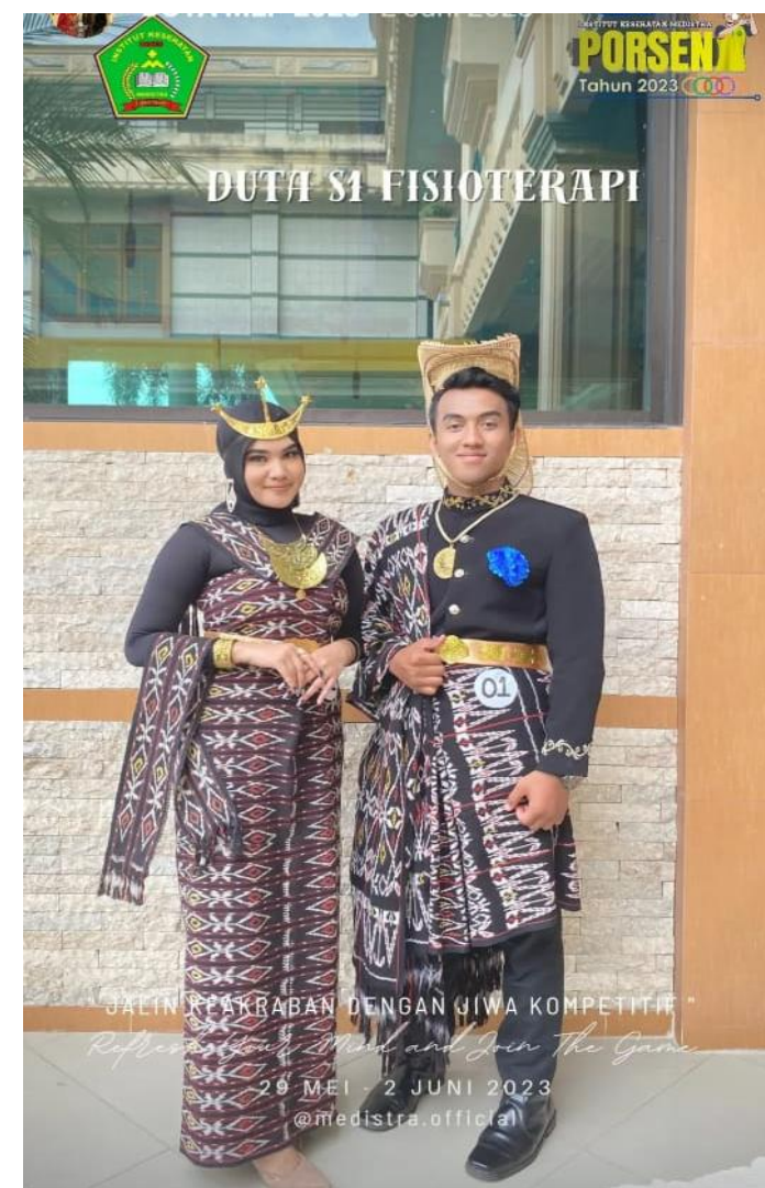
Dokumentasi Pemilihan Duta Kampus Institut Kesehatan Medistra Lubuk Pakam