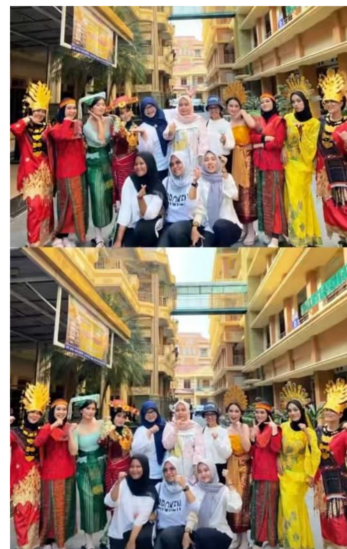
Dokumentasi Lomba Tari Tradisional dan Kreasi dari setia Program Study